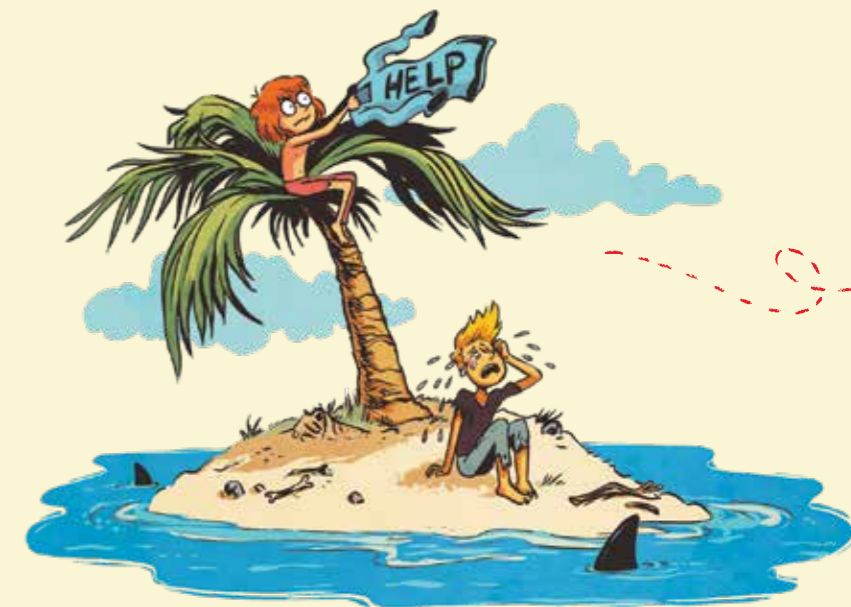
Vivre des événements difficiles aide-t-il à comprendre qui tu es ? Pourquoi ?