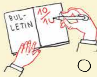
Tu lis les commentaires de l'institutrice ou de l'instituteur dans ton bulletin.