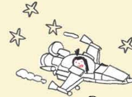
Tu t'imagines dans un futur lointain.