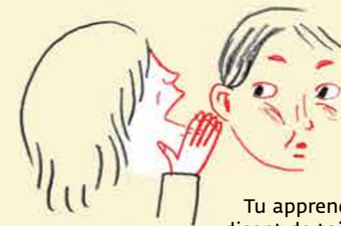
Tu apprends ce que les autres disent de toi quand tu n'es pas là.