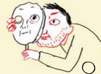
Tu découvres un aspect de la personnalité de tes parents que tu ignorais jusque-là.