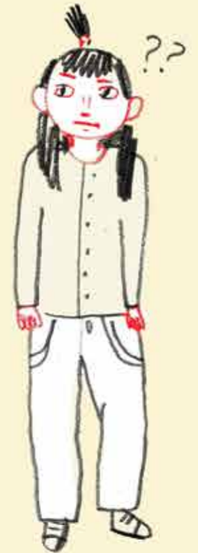
Tu es seul dans un endroit inconnu.