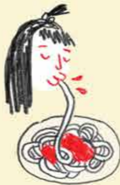
Tu établis la liste de tes plats préférés.