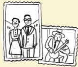
Tu en apprends plus sur la manière de vivre et l'histoire de tes arrière-grands-parents.