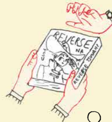
Tu prêtes un objet auquel tu tiens à quelqu'un qui risque de ne pas te le rendre.