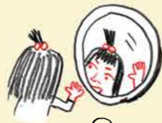
Tu t'observes dans le miroir pendant longtemps.