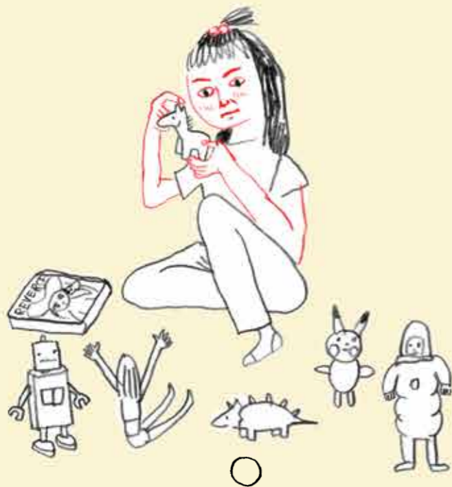
Tu classes tes livres ou tes jouets par ordre de préférence.