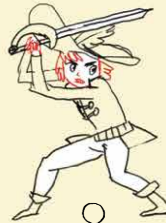
Tu te trouves devant un danger.